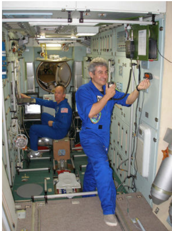
Foto de Marcos Pontes ( PY0AEB ), primeiro “passageiro” (ou caroneiro) da história espacial, apenas teve essa oportunidade devido a uma vaga comprada (por 20 milhões de dólares !) com dinheiro público numa viagem espacial da nave russa Soyuz TMA-8 até a Estação Espacial Internacional (ISS), realizada unicamente com fins eleitorais às vésperas das eleições de 2006.